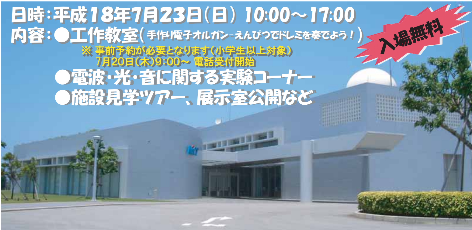
沖縄亜熱帯計測技術センターでは、電波を使った最先端の雨・風・海を測るレーダの技術開発や、亜熱帯環境の観測・研究を行っています。